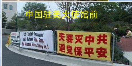
中国驻美大使馆前