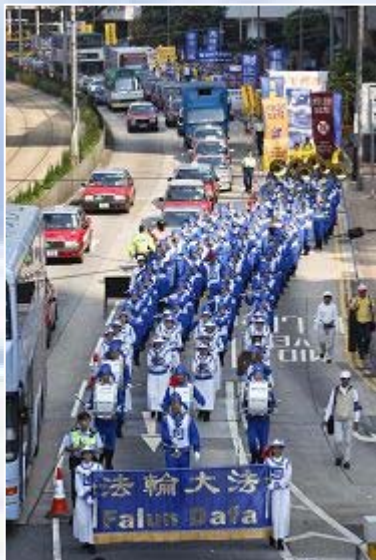
香港盛大集会游行纪念「四·二五」