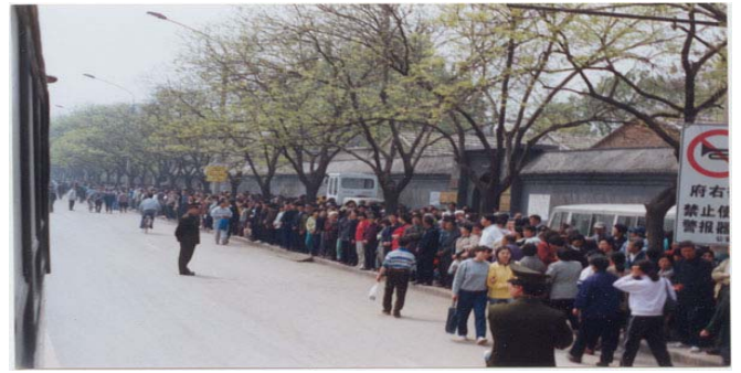
图：1999年4月25日上访的法轮功学员静静等待着向国务院信访办反映情况。