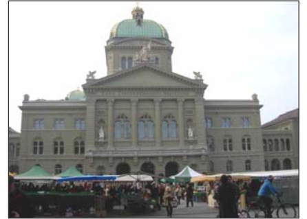
■ 多用途的瑞士联邦广场：从迎接国家元首到每周两次的农贸市场

除了游乐场，这里也是人们聚众活动的首选，因为这里与国家议会相邻。“在2009年，联邦广场