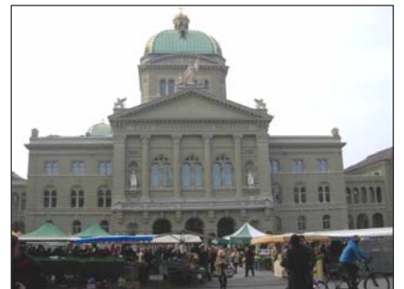
■ 多用途的瑞士联邦广场：从迎接国家元首到每周两次的农贸市场

除了游乐场，这里也是人们聚众活动的首选，因为这里与国家议会相邻。“在2009年，联邦广场