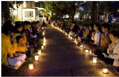
洛杉矶法轮功学员烛光纪念

“四·二五”十一周年 美国洛杉矶法轮功学员在中领馆前举行烛光纪念活动。当年身历其境的学员忆述当时景象难以忘怀，呼吁国际人士共同制止中