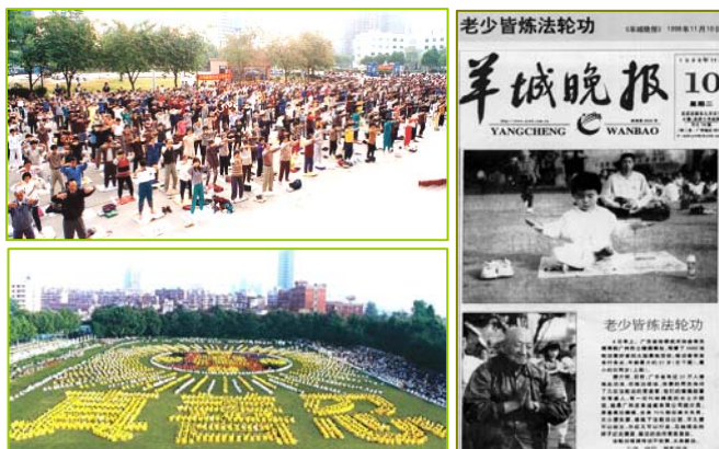
左上：1998年北京法轮功学员晨炼。这样的炼功场面1999年7月前在中国城市乡村随处可见。

法轮功传出之后，因为其独特的祛病健身奇效和在道德上的高标准要求，很快引起世人及媒体的广泛关注。《中国青年报》、《北京日报》、《中国经济时报》、《羊城晚报》及部份省市的电台、电视台对法轮功都作了正面的报道。1998年5月15日中央电视台第一套节目《晚间新闻》和第五套节目中分别报道了国家体育总局伍绍祖局长视察长春时，广大群众修炼法轮功的盛况。