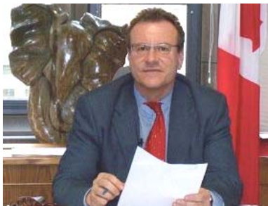
■加拿大国会议员瑞兹纽科斯基

加拿大“国会法轮功之友”副主席、国会议员博瑞·瑞兹纽科斯基（Borys Wrzesnewskyj）3月23日在接受记者采访时谈了对605决议案的看法，他说：“迫害法轮功是一个根本不应该发生的恐怖事件，现在是世人发出声音的时候了，这也是这项决议案所做的。它记录着迫害发生了十年，也在呼吁具体的行动。例如，在第二条里，呼吁废除所谓的‘六一零办公室’。”