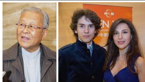
日本著名的漆工艺雕刻家木口省吾先生说：神韵是中华民族的瑰宝和骄傲。

国际著名的歌剧导演和制作人艾文·格特曼博士3月25日在加拿大温哥华观看了神韵国际艺术团在