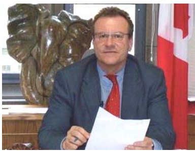
■加拿大国会议员瑞兹纽科斯基

加拿大“国会法轮功之友”副主席、国会议员博瑞·瑞兹纽科斯基（Borys Wrzesnewskyj）3月23日在接受记者采访时谈了对605决议案的看法，他说：“迫害法轮功是一个根本不应该发生的恐怖事件，现在是世人发出声音的时候了，这也是这项决议案所做的。它记录着迫害发生了十年，也在呼吁具体的行动。例如，在第二条里，呼吁废除所谓的‘六一零办公室’。”