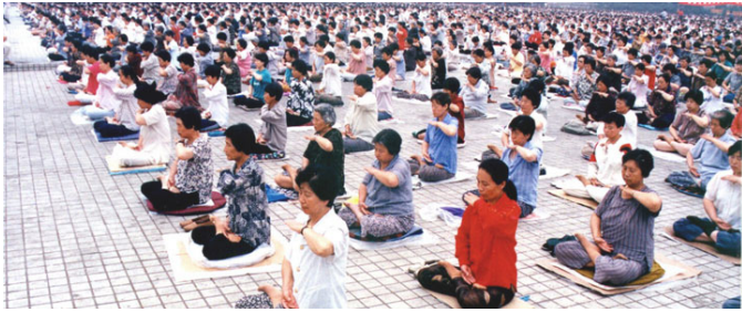
■ 1998 年 5 月，沈阳万名法轮功学员集体炼功

目前法轮功已弘传世界一百多个国家，超过一亿人修炼。法轮功书籍被翻译成三十多种文字在全世界发行。