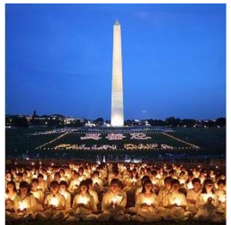
默默地矗立美国的华盛顿纪念碑，每年 7.20 见证着法轮功学员慈悲的呐喊。波澜壮阔的正义呼唤，正从它的脚下，向全世界延伸、扩展。图为华盛顿纪念碑前的大型烛光悼念活动。

主持人：非常感谢观众的收看，如果您想了解更多有关法轮功的情况请访问 www.falundafa.org 在中国可以通过象无界网，或者动态网花园网等等这些破网软件来看这些信息，谢谢收看，再见。