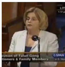
正在国会发言的议员 伊琳娜·罗斯莱亨恩

这次的 605 号，他叫 Resolution 或者有一种叫共同决议案 (Concurrent Resolution)。一般的议案，因为意见不同，利益有冲突所以要经过协调等等，是非常艰难的过程。有的议案甚至有 10 多年的过程。而且最后的效益也不会达到全票通过。这次是差一票取得全票通过，这在美国的议会史上是非常罕见的。