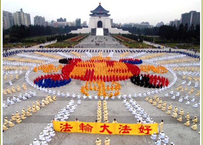
2005年12月4000多名台湾法轮功学员在台北中正纪念堂广场前排法轮图形