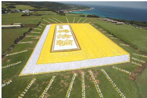
二零零九年五月九日早上，台湾六千余名法轮功学员在南台湾风光明媚的垦丁风景区埔顶大草原，排出指导修炼的《转法轮》这本书

即使是犯人，也可悔过自新而修炼。在中共迫害前，法轮功书籍流传于大陆监狱，其实并不是个别现象。例如：基于法轮功教化犯人的良效，台湾的监狱曾颁发感谢状给法轮功学员。当今，法轮功弘传世界一百多个国家和地区，获褒奖数千份。“人类需要真、善、忍，法轮功属于全世界”已成共识和事实。（文/陆文）