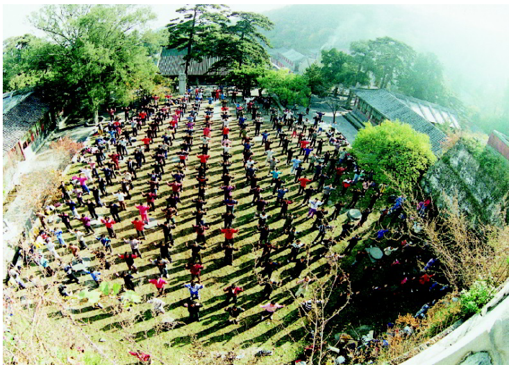
在一 北九 京九 戒七 台年 寺法 集轮 体功 炼学 功员

变戏法也没有这么快啊！穿越时空隧道？原来是师父……一股暖流涌透了他的全身，难以言表的内心的感叹：师父、大法太伟大了！◇（编者注：文中人名为化名）