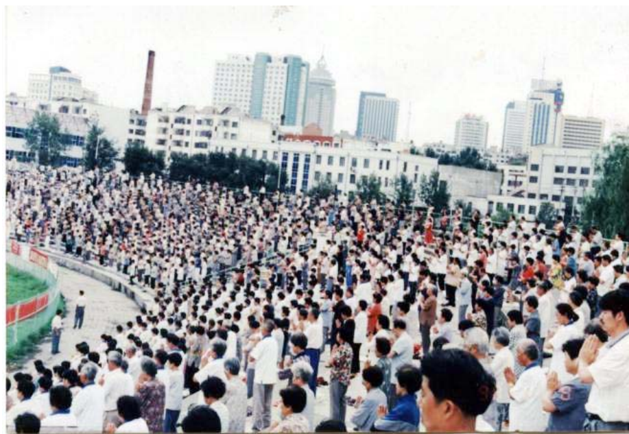
1999年，黑龙江哈尔滨市3万名法轮功学员在体育场晨炼的壮观场面。

师父接着说：“听我讲啊，气功师治病是采用超常的手法，有的人悟性好，气功师问他好不好，他说好了，就真的好了。有的人悟性差一些，气功师问好没好，他说好了，但好像还有点难受，这样一来就真的给自己留了一点。” ◇