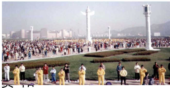
广学月一 场员'九 晨在大九 炼大连八 。连法年 星轮十 海功

孩子的母亲给男孩的额头上点了一个红点以示喜庆。师父看到后，在孩子的头上轻轻的摸了一下，孩子就不傻笑了，眼神也正常了。从此就成了一个正常的儿童。额头上的红点当时非常神奇的变成了白点。许多学员现场亲睹了师父慈悲救度小朋友的场景。◇