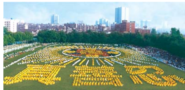
一九九七年武汉五千多名法轮功学员举行大型集体炼功，列队组字。

一传十，十传百，麻城一个月就有两千多人开始学习法轮功。这个人接着又去参加了济南法轮功学习班。在济南学习班上，他向师父献了锦旗。◇