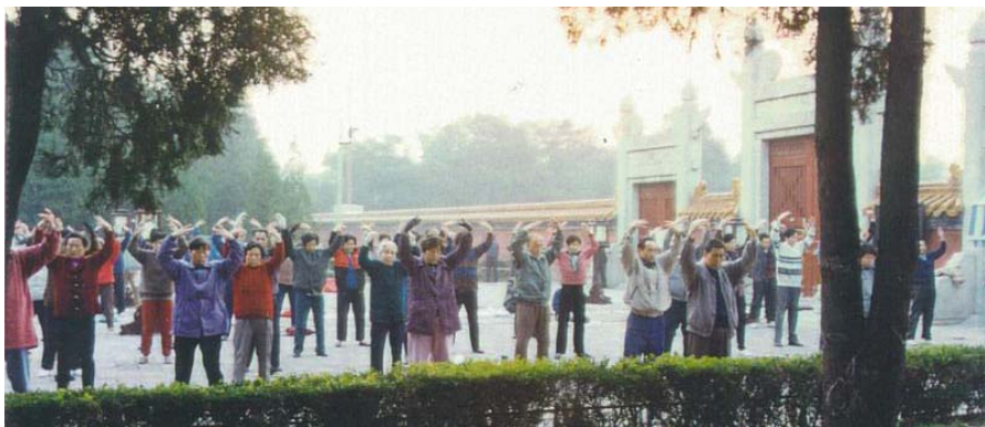
法轮功学员在北京地坛公园集体炼功

闻道者惊喜，慕道者踊跃。当时的先来者多是为了祛病健身，对师父讲的法理还不能完全理解，但每个人的身体都在天翻地覆地改变着，感受着无病一身轻的美好，一切都变得充满希望。这时候，无论师父走到哪里传功讲法，总是有很多的追随者，一个班接着一个班跟着聆听师父讲法。大家逐渐听明白了，这是佛家高层修炼大法，重要的是自身的修行，慢慢的，学员们由祛病健身走上了真正的修炼之路。◇