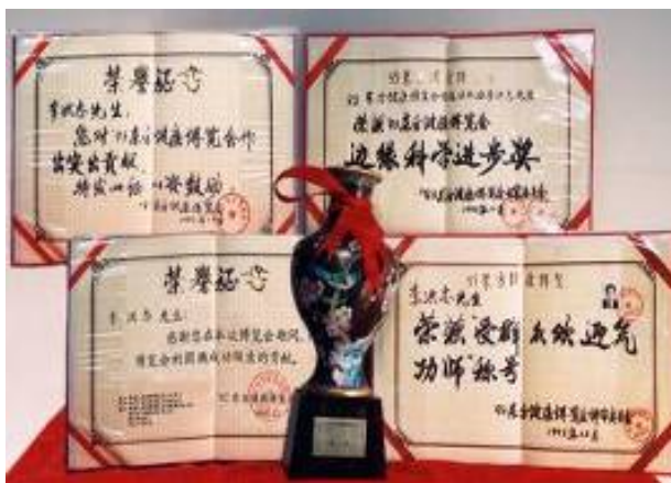
法轮功创始人在九三年东方健康博览会上的获奖证书