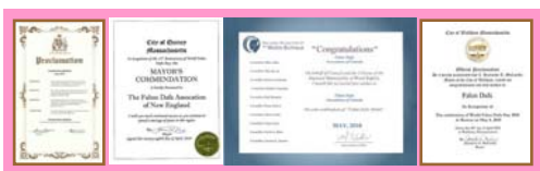
北美政要对法轮大法日的部分褒奖状

2010年5月13日是第十一届世界法轮大法日，也是法轮大法传世十八周年纪念日。日前，美国、加拿大等政要纷纷褒奖法轮大法、宣布当地的“法轮大法日”“法轮大法月”。4月21日，加拿大不列颠哥伦比亚省卡罗纳