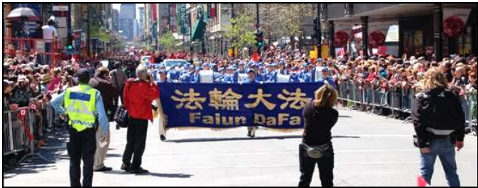
图片：天国乐团应邀参加加拿大奥委会庆典

（明慧记者郑语焉台北采访报导）位于台北县永和市著名学区的荳荳幼儿园，校风朴实，因办学以“真、善、忍”为原则，小朋友及家长均受益不浅，经由口耳相传，吸引了许多家长放心托付他们的宝贝。这些家长们不是法轮功修炼者，但都同样沐浴在“真、善、忍”润物细无声的恩泽之中。