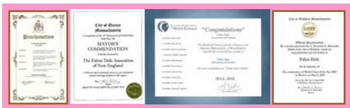
北美政要对法轮大法日的部分褒奖状

十八周年纪念日。日前，美国、加拿大等政要纷纷褒奖法轮大法、宣布当地的“法轮大法日”“法轮大法月”。4月21日，加拿大不列颠哥伦比亚省卡罗纳