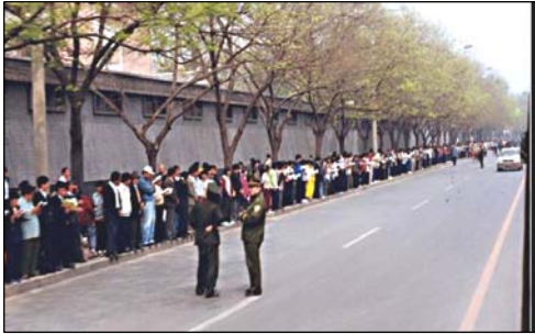
■ 4·25 上访现场秩序井然，法轮功学员文明安静，警察在一旁聊天。

大约八点多，刚经过中南海西门，石采东就听到身后人群中响起了掌声，在这片宁静中显得格外清脆。“我转身回看，只见朱镕基和几个工作人员正从对面大门朝学员走来。大家都高兴地鼓掌，准