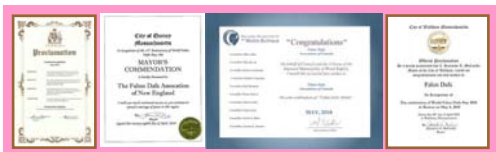
北美政要对法轮大法日的部分褒奖状

十八周年纪念日。日前，美国、加拿大等政要纷纷褒奖法轮大法、宣布当地的“法轮大法日”“法轮大法月”。4月21日，加拿大不列颠哥伦比亚省卡罗纳