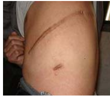
初庆华身上伤疤长 30 多公分

说，有事要与他们商量，待他们俩刚到屋，就被四五个恶警强行按住、绑架，当天就被当地派出所接回。