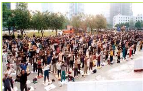
■ 99 年 7 月前在中国城市乡村法轮功学员炼功场面随处可见，图为 1998 年北京法轮功学员晨炼。

● 法轮大法弘传世界 法轮功已弘传世界 114 个国家和地区，受到世界人民的爱戴和尊敬。因李洪志先生和法轮大法对人类身心健康作出的杰出贡献，至今获得各国政府褒奖、支持议案信函超过 3000 项。法轮功书籍被译成 30 多种语言。自 2000 年起，李洪志先生连续四年被提名诺贝尔和平奖。