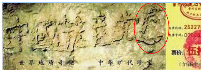
▲2002年在贵州平塘县掌布乡发现的藏字石，石头断面上天然形成六个字：中国共产党亡，最后的“亡”字特别大，昭示着“天灭中共”的天意。图为风景区门票。