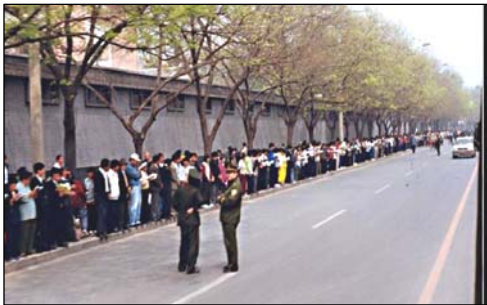
■ 4·25 上访现场秩序井然，法轮功学员文明安静，警察在一旁聊天。

“我很少出来，就想先转转，找个认识的人了解一下情况。后来人越来越多，多得不见尽头。男女老幼的学员都安安静静地等着里面的人出来听大家反映情况，没有人喊口号、大声喧哗、交头接耳什么的，有的捧着书在看，有的在炼功。我走过一个小区，看到街对面的小公园外面，有好多人在排队上厕所，很自觉地排队。那天人虽多，感觉交通跟平时差不多的通畅，骑自行车的也来来往往的，一点都没有人多杂乱的感觉。”