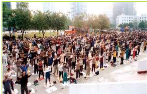
■ 99 年 7 月前在中国城市乡村法轮功学员炼功场面随处可见，图为 1998 年北京法轮功学员晨炼。

● 法轮大法弘传世界 法轮功已弘传世界 114 个国家和地区，受到世界人民的爱戴和尊敬。因李洪志先生和法轮大法对人类身心健康作出的杰出贡献，至今获得各国政府褒奖、支持议案信函超过 3000 项。法轮功书籍被译成 30 多种语言。自 2000 年起，李洪志先生连续四年被提名诺贝尔和平奖。