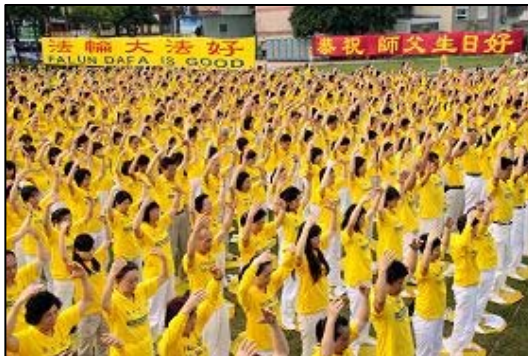
台湾中坜市法轮功学员集体炼功向世人展示功法的美好