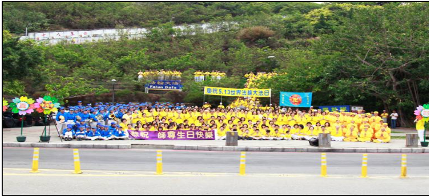
台湾高雄的法轮功学员在著名的风景区西子湾，欢庆世界法轮大法日，恭祝师尊生日快乐。

台湾高雄法轮功学员在高雄著名风景区西子湾和莲池潭，欢庆世界法轮大法日，恭祝师父生日快乐，感念师尊慈悲救度。几十辆游览车的来台的大陆游客看到大法在海外弘传的盛况，都惊叹不已并纷纷合照存影。