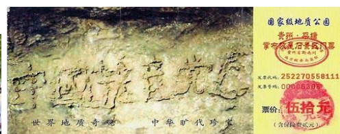
贵州省平塘县掌布乡亿年藏字石天成“中国共产党亡”六个大字。图为国家级地质公园门票