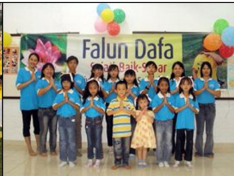
印尼巴淡岛明慧学校的学生们欢庆世界法轮大法日