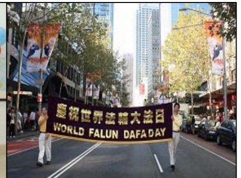
五月八日，百余名悉尼法轮功学员举行了游行和庆典活动