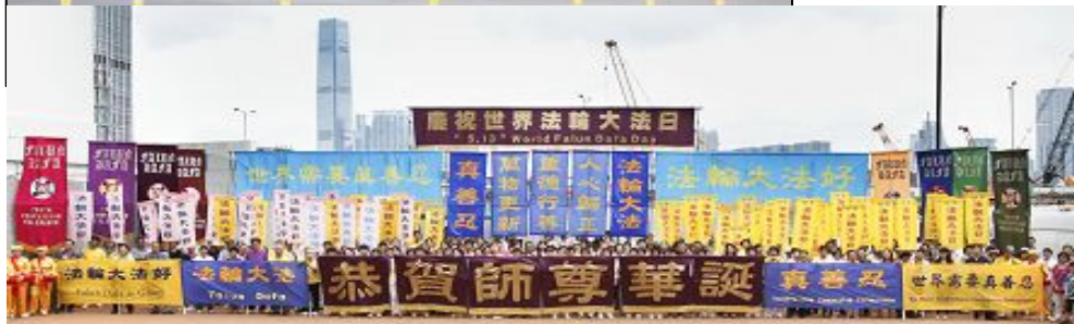
香港法轮功学员庆祝大法弘传，同时恭祝法轮功创始人李洪志先生生日快乐。