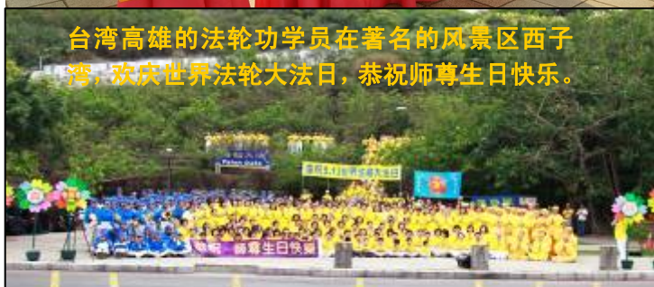
台湾高雄的法轮功学员在著名的风景区西子湾，欢庆世界法轮大法日，恭祝师尊生日快乐。