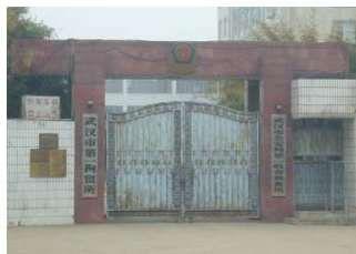
武汉市第一拘留所