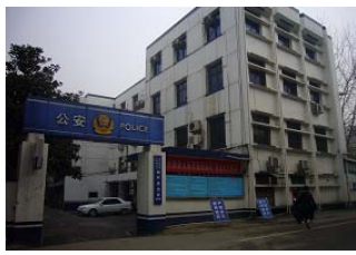
东西湖区新村派出所