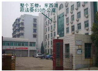
东西湖区政法委 610 办公室