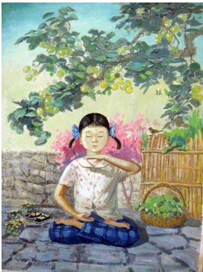
■法轮功学员创作的水彩画