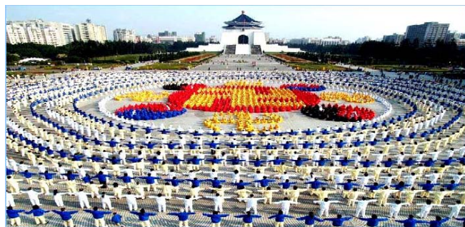
■ 2005年12月25日，台湾4000多名法轮功学员集体炼功，排组法轮图形。

法轮功迄今已弘传世界114个国家和地区，受到世界人民的爱戴和尊敬。因李洪志先生和法轮大法对人类身心健康作出的杰出贡献，已获得各国政府褒奖、支持议案信函超过3000项。法轮功书籍被译成30多种语言。自2000年起，李先生连续四年被提名诺贝尔和平奖。