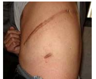
初庆华身上伤疤长 30 多公分

初庆华被保外就医时，王村劳教所恶警李公明，害怕罪行被世人知道，竟卑鄙的用其舅舅家的家产做抵押，威胁初庆华不许把受到的迫害说出去。