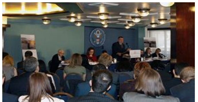
美国国际宗教自由委员会在国家记者俱乐部发布二零一零年度报告

美国国际宗教自由委员会于一九九八年依美国国会通过的国际宗教自由法成立, 独立于行政部门之外运作, 监督世界各国的宗教自由状况, 并向美国政府、国务卿和国会提出政策建议。◇