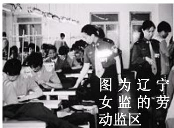
图为辽宁女监的劳动监区