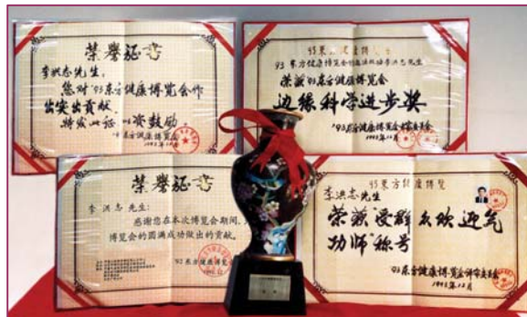
图：李洪志老师荣获 93 年健康博览会“边缘科学进步奖”和“受群众欢迎气功师”称号