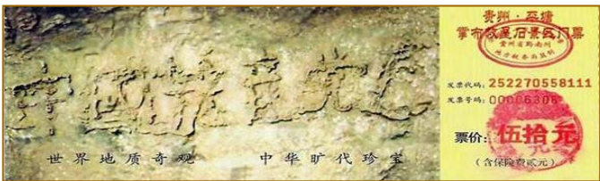
贵州省平塘县风景区内的“藏字石”，距今 2.7 亿年，石头断面上天然形成六个大字：中国共产党亡。

其实老百姓心里都有杆秤，只要多了解真相，就不会吃亏上当。民间的一个顺口溜说得好： 此时天象不一般，多听多看才不冤。 不久就要真相显，方知今日是机缘！ 愿朋友们保持心明眼亮，为自己选择一个美好的未来。（文／乡亲）