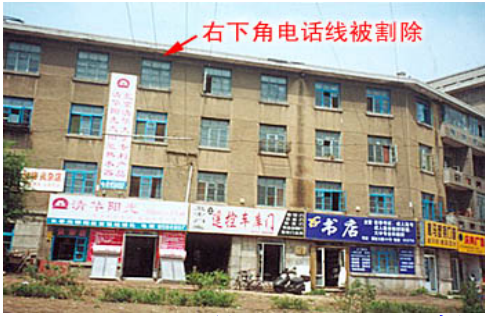
师父长春的家 (根本不是什么豪宅)

被火烧了，唯独师尊家安然无恙。这件事情当时在学员中流传甚广，大家都觉得很神奇。”