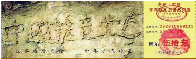
贵州省平塘县风景区内的“藏字石”，距今 2.7 亿年，石头断面上天然形成六个大字：中国共产党亡。

宪法规定信仰自由。法轮功学员信仰真善忍，坚守道德良知做好人，却被以莫须有为名造谣诬陷迫害。迫害善良，天理不容，希望执法人员悬崖勒马，不要再执迷不悟，认真了解法轮功真相，不要再被共产党搞整人斗人的政治运动的造谣宣传所蒙蔽，为自己的行为负责，不要