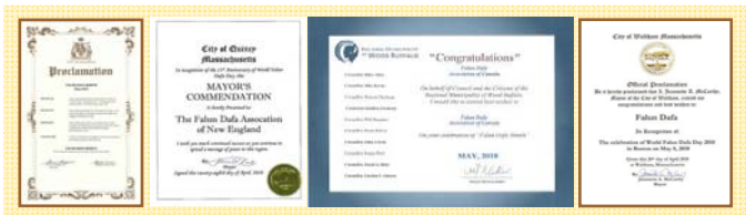
■北美政要对法轮大法日的部分褒奖状