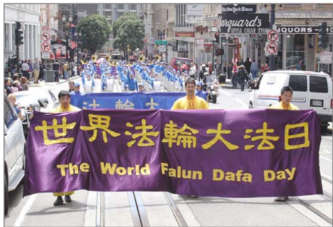
美国旧金山市法轮功学员庆祝世界法轮大法日