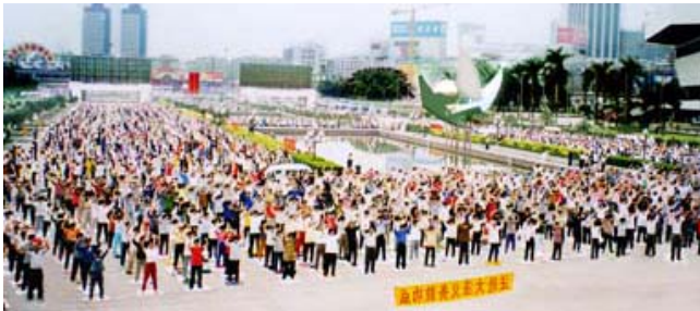
一九九八年广州法轮功学员们在广场晨炼

后来花自己的钱就不那么难受了。那时我把皮包分成两格，一格装自己的钱，一格装“公款”，办私事绝不用公款。再后来，花自己的钱成了习惯，我个人写信都不用单位的信封。也没人监督，就自然而然的想到法轮功，然后就凭着良心做了。从那往后觉的活得特别明白，特别坦荡，每天都是从心里往外的舒畅。十年来我没再吃过一粒药。女士都爱做美容，我也没有做美容，可是多年未见的人都惊奇的问我：“年轻多了，脸上怎么不长皱纹呢？”