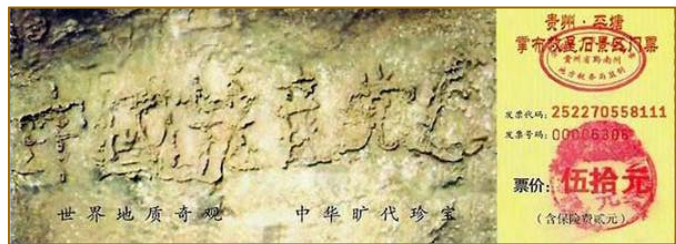
■贵州省平塘县风景区内的“藏字石”，距今2.7亿年，石头断面上天然形成六个大字：中国共产党亡。

我的一个朋友指着“藏字石”风景区门票（下图），呵呵直乐：“明明上面是六个大字，共产党的媒体却不敢提第六个字，导游也说只有五个字。睁着眼睛说瞎话啊！”