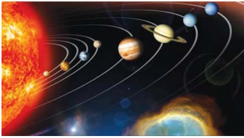
■ 精美的太阳系是偶然形成的吗？

他从研究自然的奥秘开始，最终进入了信仰的殿堂，向世人证明了高级生命所创造的宇宙是何等奇妙和伟大。