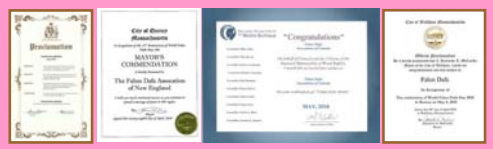
北美政要对法轮大法日的部分褒奖状

2010 年 5 月 13 日是第十一届世界法轮大法日，也是法轮大法传世十八周年纪念日。日前，美国、加拿大等政要纷纷褒奖法轮大法、宣布当地的“法轮大法日”“法轮大法月”。4 月 21 日，加拿大不列颠哥伦比亚省卡罗纳市市长宣布五月为法轮大法月。市长莎伦·谢波德在褒奖状（上图）中写道：“法轮大法修炼者在日常生活中遵循真、善、忍的原则。来自各种宗教信仰、不同年龄的人们都从法轮大法中得到了身心健康。”