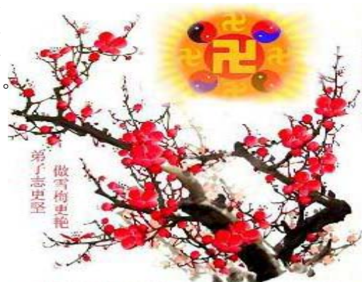
乐山全体大法弟子恭祝师尊生日快乐！普天同庆世界法轮大法日！

二零零零年五月，为纪念法轮大法传世这个伟大日子，在世界各地法轮功学员的倡议下，各国法轮大法学会共同决定将五月十三日订为“世界法轮大法日”。从此，全世界大法弟子和善良民众在每年的这一天普天同庆，分享大法带给生命的希望与美好。