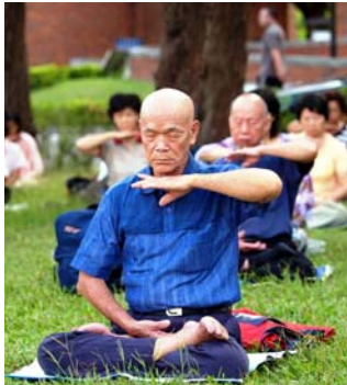
目前，法轮功已弘传世界 114 个国家和地区，修者上亿人。

人们普遍认为，中国现在处于道德与信仰真空的时代。然而，在法轮功学员身上，我们看不到道德真空，看不到信仰真空。我们看到的是，即使在中共的血腥迫害面前，法轮功学员们仍然坚定地信仰和实践着“真善忍”，这是非常可贵的，也是中国急需的。（文 / 林展翔）