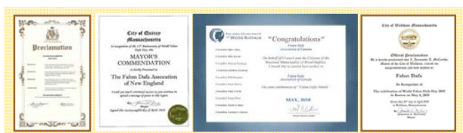
■北美政要对法轮大法日的部分褒奖状