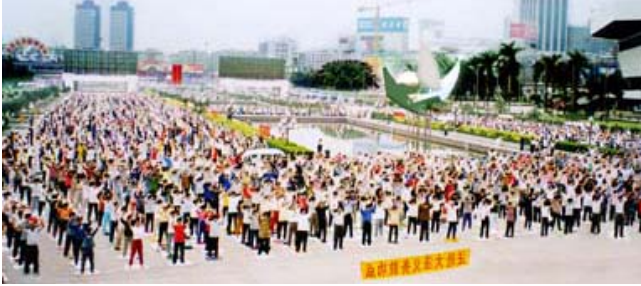
一九九八年广州法轮功学员们在广场晨炼

后来花自己的钱就不那么难受了。那时我把皮包分成两格，一格装自己的钱，一格装“公款”，办私事绝不用公款。再后来，花自己的钱成了习惯，我个人写信都不用单位的信封。也没人监督，就自然而然的想到法轮功，然后就凭着良心做了。从那往后觉的活得特别明白，特别坦荡，每天都是从心里往外的舒畅。十年来我没再吃过一粒药。女士都爱做美容，我也没有做美容，可是多年未见的人都惊奇的问我：“年轻多了，脸上怎么不长皱纹呢？”