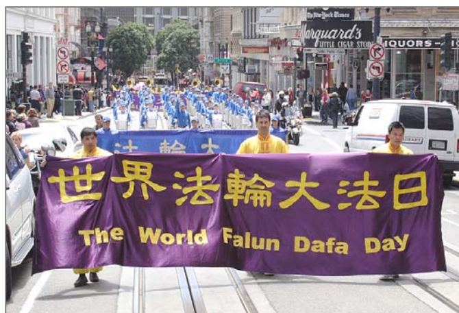
美国旧金山市法轮功学员庆祝世界法轮大法日