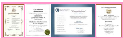
北美政要对法轮大法日的部分褒奖状

十八周年纪念日。日前，美国、加拿大等政要纷纷褒奖法轮大法、宣布当地的“法轮大法日”“法轮大法月”。4月21日，加拿大不列颠哥伦比亚省卡罗纳