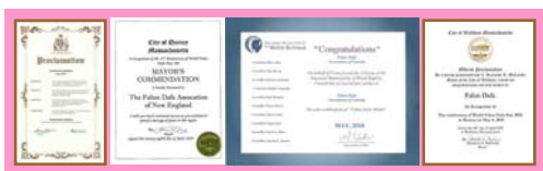
北美政要对法轮大法日的部分褒奖状

十八周年纪念日。日前，美国、加拿大等政要纷纷褒奖法轮大法、宣布当地的“法轮大法日”“法轮大法月”。4月21日，加拿大不列颠哥伦比亚省卡罗纳