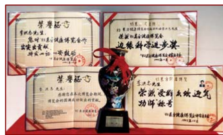
图：李洪志老师荣获 93 年健康博览会“边缘科学进步奖”和“受群众欢迎气功师”称号

到了博览会的最后一天上午，大厅里中间中西医摊位的医生，右边的卖医疗器械的人都丢下自己的摊位