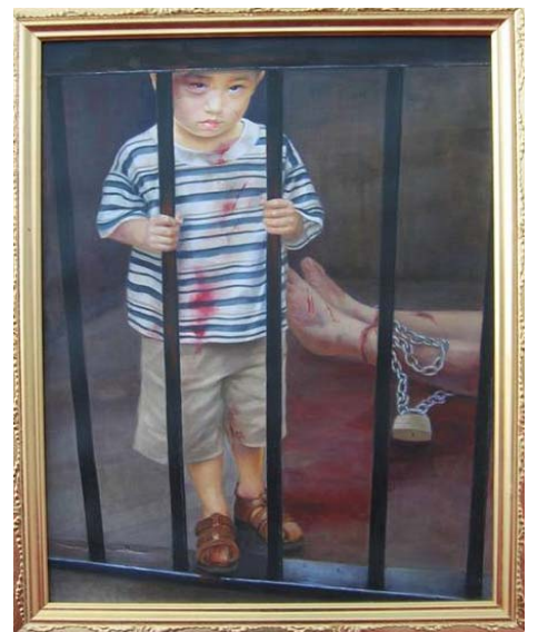
“真善忍国际美展”展出作品