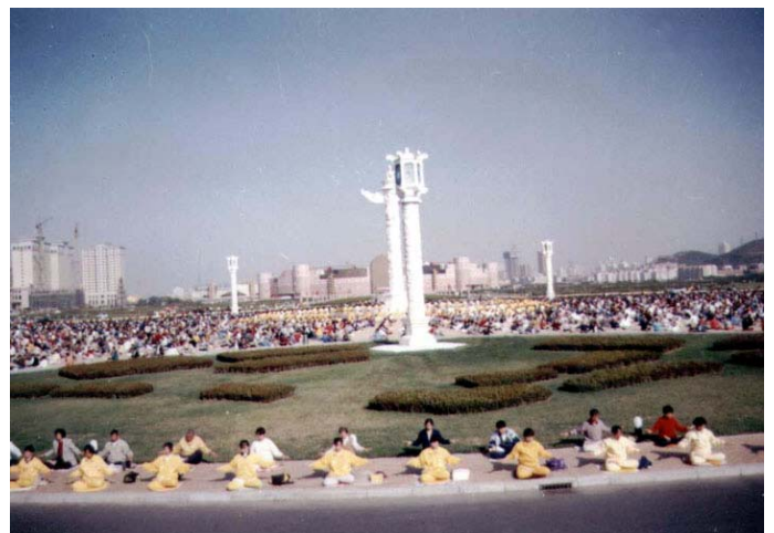
大连星海广场万人晨炼的盛景

【明慧网】修炼法轮大法前，我饱受疾病的折磨，行走困难，近乎瘫痪。是伟大的师尊，给了我第二次生命，并指引我走上了修炼之路。