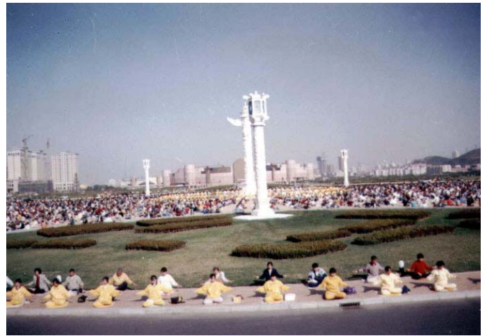
大连星海广场万人晨炼的盛景