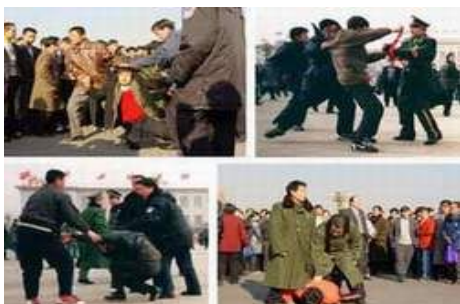
左图：在北京天安门和平请愿的法轮功学员被恶警当众野蛮毒打

这里只是揭露出薄熙来在中共迫害法轮功开始时所犯下罪行的一幕，更多惨绝人寰的迫害真相，已有大量的事实陆续揭露出来。薄熙来因为迫害法轮功罪行严重，目前已在美国、英国、德国、阿尔兰、新西兰、俄罗斯、澳大利亚、韩国、西班牙、瑞典等十几个国家，被法轮功学员以谋杀罪、反人类罪、酷刑罪等告上法庭。二零零七年，被澳洲法轮功学员告上法庭的薄熙来被澳洲法院宣判罪名成立，成为海外被判决有罪的中共最高官员。二零零九年十一月，西班牙国家法庭日前做出裁定，以“群体灭绝罪”及“酷刑罪”起诉迫害法轮功的首恶江泽民、罗干、薄熙来、贾庆林、吴官正五名中共官员。薄熙来的恶行令其在所到之处成为唾弃者。