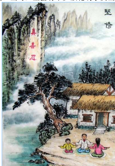
■ 2010 年“5.13”第十一届世界法轮大法日来临之际，大陆及海外法轮功学员纷纷以文章、书法、传统工艺、绘画、摄影、音乐等形式，投稿至明慧网以示庆贺。图为山东法轮功学员创作的水墨画《坚修》。

我们放心，不贪，不占，不抽烟，不喝酒，不嫖娼，不索贿。当时，全县有不少法轮功学员当村干部。