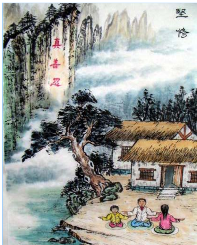
大陆法轮功学员庆祝“五·一三”“世界法轮大法日” 绘画作品精选●水墨画：坚修