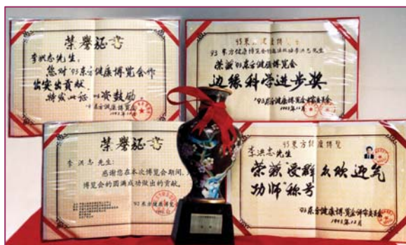
图：李洪志老师荣获 93 年健康博览会“边缘科学进步奖”和“受群众欢迎气功师”称号