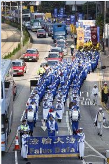
香港盛大集会游行纪念「四、二五」