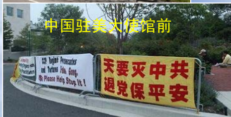
中国驻美大使馆前