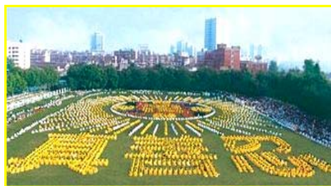
■图 为 1998 年，武汉 5000 多名法轮功学员集体炼功。

因李洪志先生和法轮大法对人类身心健康作出的杰出贡献，至今获得各国政府褒奖、支持议案信函超过3000项。自2000年起，李洪志先生连续四年被提名诺贝尔和平奖。◇