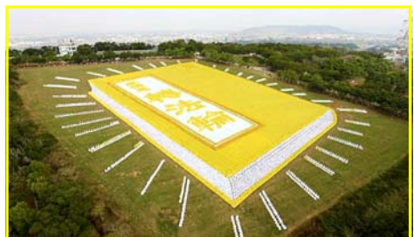
■图 为 2009 年 11 月 21 日，6 千多名亚太地区的法轮功学员举办大型排字活动。