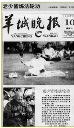
左上：1998 年北京法轮功学员晨炼。这样的炼功场面 1999 年 7 月前在中国城市乡村随处可见。