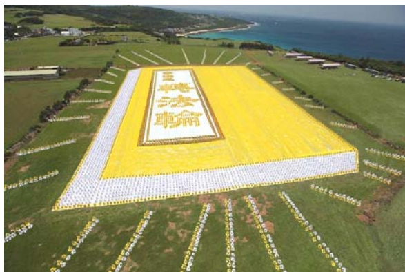
二零零九年五月九日早上，台湾六千余名法轮功学员在南台湾风光明媚的垦丁风景区埔顶大草原，排出指导修炼的《转法轮》这本书

即使是犯人，也可悔过自新而修炼。在中共迫害前，法轮功书籍流传于大陆监狱，其实并不是个别现象。例如：基于法轮功教化犯人的良效，台湾的监狱曾颁发感谢状给法轮功学员。当今，法轮功弘传世界一百多个国家和地区，获褒奖数千份。“人类需要真、善、忍，法轮功属于全世界”已成共识和事实。（文/陆文）◇