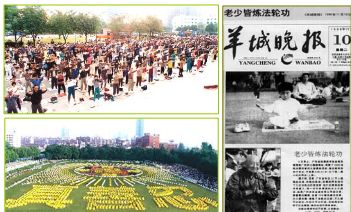
左上：1998 年北京法轮功学员晨炼。这样的炼功场面 1999 年 7 月前在中国城市乡村随处可见。 左下：1997 年武汉 5000 多法轮功学员炼功组字。 右：《羊城晚报》报道《老少皆炼法轮功》（1998.11.10）

1999 年 4 月，何祚庥（政法委书记罗干的连襟，其身份是科学院院士）在天津教育学院《青少年科技博览》上撰文诬陷法轮功。在法轮功学员澄清事实的过程中，天津警方接到上级指示，非法抓捕法轮功学员（法轮功学员在天津市政府被告知：公安部介入了这个事件，你们 去北京才能解决问题），