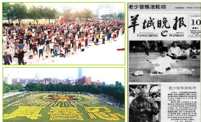
左上：1998 年北京法轮功学员晨炼。这样的炼功场面 1999 年 7 月前在中国城市乡村随处可见。 左下：1997 年武汉 5000 多法轮功学员炼功组字。 右：《羊城晚报》报道《老少皆炼法轮功》（1998.11.10）