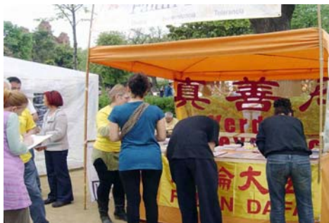
人们在呼吁制止中共迫害法轮功的签名簿上签名

二十四日、二十五日，巴塞罗那的天气格外晴朗，艳阳高照。绿草如茵的凯旋门公园到处都是欢庆地球日的人群。一大早，介绍法轮大法的展位前就汇聚了很多游人。人们被祥和的炼功场面所吸引，前来咨询关于炼功的更多信息。也有善良的民众被展位上揭露中共迫害法轮功学员的真相图片所震惊，前