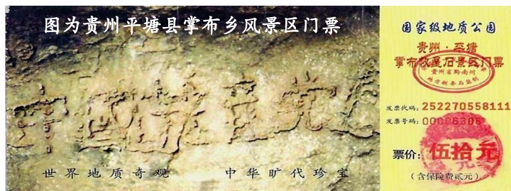
图为贵州平塘县掌布乡风景区门票