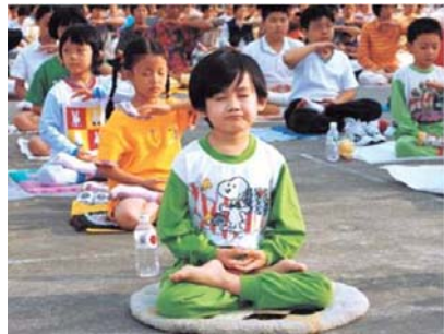
■ 1998 年中共未镇压前，法轮功小弟子在广州的修炼心得交流会上集体炼功。他们一起交流如何按照“真善忍”做一个好孩子。