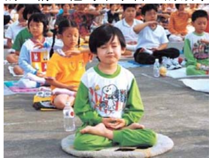
■ 1998 年中共未镇压前，法轮功小弟子在广州的修炼心得交流会上集体炼功。他们一起交流如何按照“真善忍”做一个好孩子。