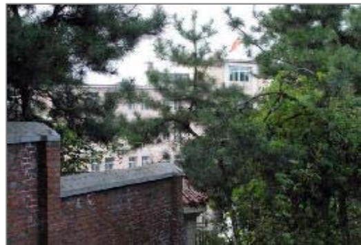
▲洗脑班的楼。房间窗户都被铁栅栏封闭，显得阴森恐怖。