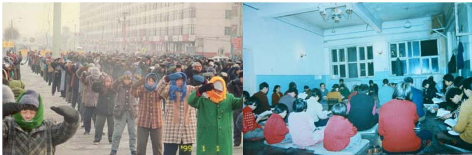
历史照片：黑龙江省双城市法轮功学员集体炼功，集体阅读法轮大法书籍

没有谁要求他们这样做，也没有谁布置他们这样做，这些贺信、贺卡和贺词都是海内外法轮功学员和明白真相的普通人自愿发出的，表达了他们对李洪志先生的感恩之情和坚修法轮大法的坚定信念。尤