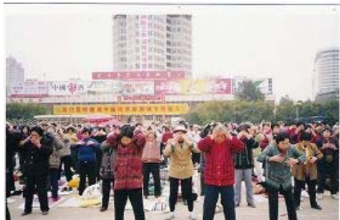
■ 1999 年昆明工人文化宫每天千人炼功的场面，图为第四套功法——法轮周天法

法轮功学员乙修炼法轮功之前身患多种要命的病：心脏病、十二指肠溃疡、晚期癌症手术后扩散到头部，头顶象被尖刀刺着，昼夜疼痛难忍，被医院宣布无治而在家等死，那时体重只有 30 来公斤。