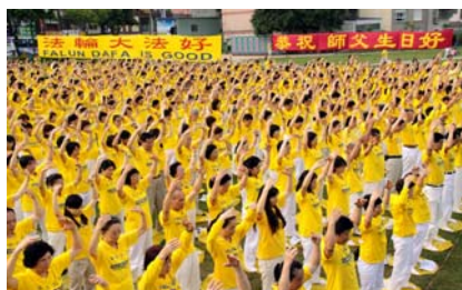
5 月 8 日在台湾中坜市的中正公园，近千名法轮功学员集体炼功