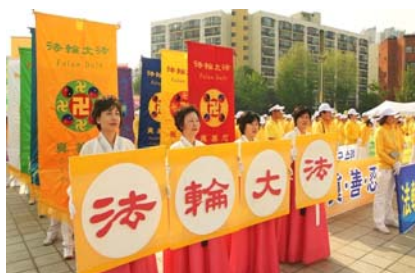
5 月 9 日韩国 700 多名法轮功学员在首尔奥林匹克公园举行集会游行

1992 年 5 月 13 日，法轮大法（也称“法轮功”）从中国吉林省传出。面对中共当局长达十余年的残酷迫害，法轮功依然传遍全球 110 多个国家和地区，使各族裔上亿人身心受益。法轮功的主要著作被翻译成三十多种语言。法轮功荣获各界颁发的褒奖达一千五百多个；全世界通过支持法轮功的决议案二百三十四个。