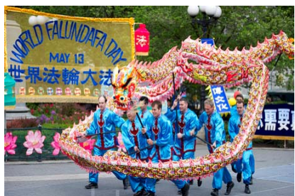
5 月 9 日纽约法轮功学员在曼哈顿联合广场举行庆典