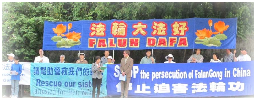
温哥华法轮功学员于二零一零年六月十九日中午在中领馆前集会，强烈呼吁制止中共迫害法轮功。