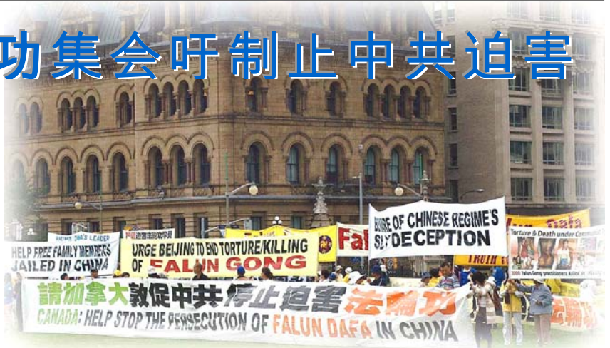
法轮功学员在国会山前呼吁加拿大总理、政府和国会在胡锦涛访加期间敦促其停止迫害法轮功

当局发起的这场有系统的对法轮功的迫害已超过十年了，其手段包括监狱、酷刑、仇恨宣传、洗脑、信息封锁、谋杀甚至活摘被监禁法轮功学员的器官。到今天为止，能够证实的迫害致死人数已达几千人。几百万的家庭被拆散。血腥的迫害已被世界上所有主要的人权机构记录在案，其中包括联合国。”联合国的声明中说：“（我们）在关注对法轮功修炼者的逮捕、酷刑、性侵犯、致死，以及不公正的审判，表明了或许有专门针对法轮功的政策。”他们还声明，“这些惨无人道的酷刑难以用文字描述。”