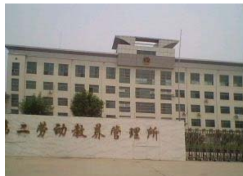
山东省第二劳教所大门口

← 山东省第二劳教所恶警用吊铐酷刑折磨法轮功学员示意图,有的大法学员被关在劳教所小号里,铐在门上长达八十多天。