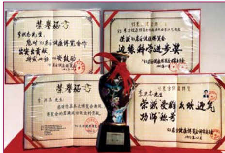
图: 李洪志老师荣获 93 年健康博览会“边缘科学进步奖”和“受群众欢迎气功师”称号

来找师父治病的大多是全国各地的疑难杂症, 有轮椅推着的, 有担架抬着的, 还有一对农村来的夫妇用铁架子抬着孩子去的。不时从法轮功摊位拥挤的人群中传出“法轮功能治病”、“法轮功治病快”。不时地听到法轮功摊位的鼓掌声、喝彩声、感激道谢声、哭声, “(病)好了!(病)